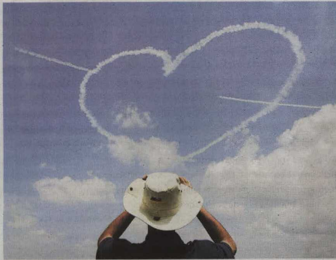
FELICIDAD MUCHAS PERSONAS UTILIZAN ESTAS PUBLICACIONES COMO GUÍAS PARA MEJORAR SUS VIDAS.