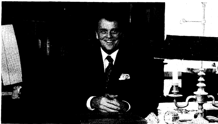
El escritor Spencer Johnson, en su despacho.

Pocos escritores pueden presumir de un éxito tan apabullante como Spencer Johnson. El famoso autor de «¿Quién se ha llevado mi queso?» vendió sólo en España medio millón de ejemplares. Su clave, abordar problemas complejos a través de historias sencillas. Millones de personas han reconocido que su lectura ha servido para salvar su carrera profesional e incluso su matrimonio. Licenciado en Psicología y doctor en Medicina, Spencer Johnson asegura que la gente que no está dispuesta a aceptar los constantes cambios de la sociedad actual «se encuentra en peligro de extinción». -Sus libros han tenido un gran éxito en todo el mundo. ¿Cómo relatos tan breves pueden cambiar la vida de tantas personas?