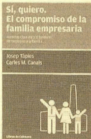
Libros de cabecera.