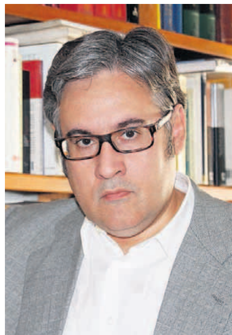
Juan Manuel de Prada.

llante caja de resonancia lingüística y una impecable capacidad para la construcción de la frase bien hecha. Luego, tras aquella obra inicial que hacía refulgir las miserias de los desgarrados y excéntricos, desarrolló con éxito su vocación de momificarse en las páginas del "Abc", cual Azorín , tendiendo cada vez de forma más marcada al conservadurismo de corte católico y a la pedantería. Es precisamente de las colaboraciones cinéfilas en el suplemento cultural del "Abc" de donde sale Los tesoros de la cripta , que viene a ser un personal repaso de la historia del cine desde los hallazgos pioneros del mudo hasta la primera década del presente siglo; desde la Cabiria de Giovanni Pastro-