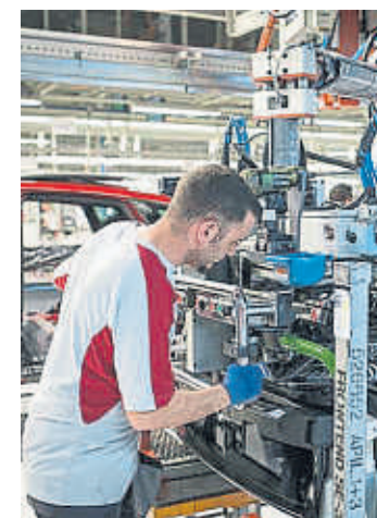
Seat en Martorell

■ Los sindicatos de Seat han propuesto a la dirección de la empresa que se puedan trasladar trabajadores de la factoría de Martorell a las nueva planta de baterías que el grupo Volkswagen pondrá en marcha en Sagunt (Valencia) en el año 2024. Es una de las propuestas puestas encima de la mesa por CC.OO. y UGT para absorber parte del excedente de plantilla esperado en la fábrica de Martorell cuando llegue el ensamble de vehículos eléctricos, que se cifra en 2.500 o 2.800 empleados. /Redacción