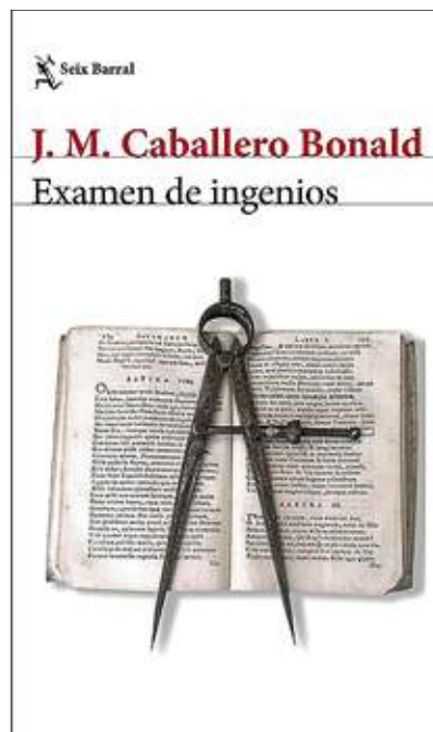
José Manuel Caballero Bonald Examen de ingenios SEIX BARRAL

P ara algunos el mejor escritor español actual -cuando menos el más longevo-, Caballero Bonald suele inscribirse en la generación de los 50. Sigue pensando que la poesía es una defensa contra las ofensas de la vida, y reivindica la duda y la incertidumbre como componentes ineludibles del pensamiento crítico. La reflexión crítica y la anécdota se dan la mano en su último libro, Examen de ingenios -título tomado de Huarte de San Juan-, donde se acerca a una serie de artistas, escritores y músicos que, por alguna razón, le han atraído y a los que ha tratado en alguna ocasión. Ordenadas de forma cronológica (no por su fecha de nacimiento, sino por el orden en que los conoció), estas semblanzas van configurando una especie de autobio-