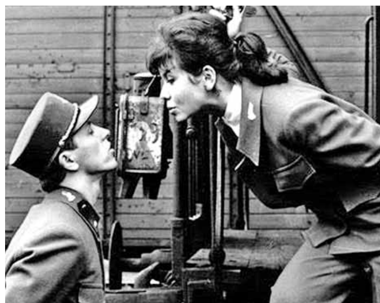
Un fotograma de la película "Trenes rigurosamente vigilados".

camarero Dite de Yo que he servido al rey de Inglaterra , voces autónomas y dicharacheras, caracterizadas por una dicción insomne, especie de verborrea perpetua que nada ni nadie consiguen aplacar, y que han contribuido a hacer de la prosa de Hrabal una letanía acerca del tiempo, la galantería y la fatalidad, siempre con un humor negro aunque a la vez muy dulce como telón de fondo. El narrador sin nombre de Trenes rigurosamente vigilados presenta la marca de agua de la escritura hrabaliana, ese talento para armonizar lo terrible y lo ingenuo en un único cuadro, aquí contenido en el heroico desempeño de la inolvidable pareja formada por un factor calavera, de apellido Hubicka, y un aspirante al puesto virgen y obsesionado con las mujeres, llamado Milos Hrma,