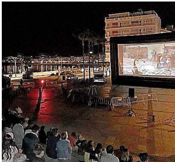
Emisión en Sanxenxo, concello integrado na RDL

ma de dinamización lingüística Redecinema que está achegando ata setembro a 17 concellos da Rede de Dinamización Lingüística (RDL) da Xunta de Galicia promovido desde a Consellería de Cultura, Educación e Ordenación Universitaria, a través das secretarías xerais de Política Lingüística e de Cultura e da Axencia Galega das Industrias Culturais (AGADIC). x.g.