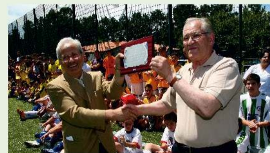
Agradecimiento patrocinio Club de Fútbol Cordeiro - Valga

Debemos obrar como hombres de pensamiento, debemos pensar como hombres de acción.