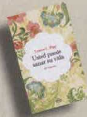
USTED PUEDE SANAR SU VIDA Louise L. Hay Urano. 254 págs. 11 €.

La colección Urano Vintage devuelve a nuestras estanterías algunos títulos indispensables en el ámbito del desarrollo personal. Así, en su lanzamiento inicial encontramos la que quizá sea la obra más significativa de la literatura de crecimiento personal, Usted puede sanar su vida , de la terapeuta Louise L. Hay. En él, se ponen de manifiesto algunos principios básicos para convivir mejor con uno mismo y con los demás creando a través del pensamiento una realidad más optimista. Otros clásicos del género son Aprendo Yoga y Perfecciono mi yoga , del maestro André Van Lysebeth, considerado el gran impulsor de esta disciplina milenaria en Occidente. Su método de aprendizaje, claro y completo, adapta las técnicas de los antiguos maestros a las necesidades propias de la vida actual.