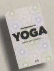
APRENDO YOGA André Van Lysebeth Urano. 318 págs. 16 €.