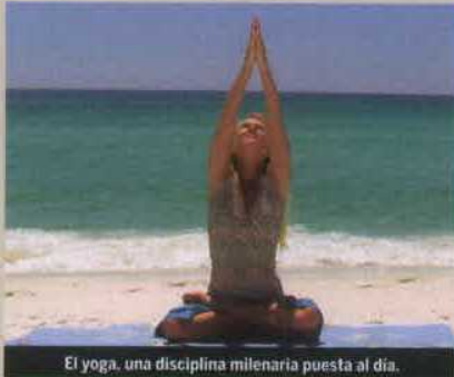
El yoga, una disciplina milenaria puesta al día.

La colección Vintage de Urano apuesta por recuperar algunos de los clásicos intemporales de la literatura dedicada al desarrollo personal.