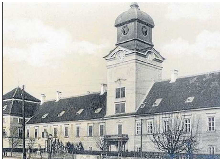
Castillo de Rechnitz. L. O.

nuar. Los invitados no pasan de los 50. Un selecto grupo de jefes de jefes nacionalistas, mandos de la Gestapo y las SS. Los chicos de las Juventudes Hitlerianas dan color adolescente a copas y viandas y músicas. El alcohol corre y las borracheras crecen en el castillo. A turbar tanta inconsciencia llega una noticia. Ha llegado a Rechnitz una partida de judíos, extraídos de campos de concentración, mano de obra para excavar trincheras, algunos con tifus. Hacen a unos 200 en los sótanos del palacio donde se corría aquella