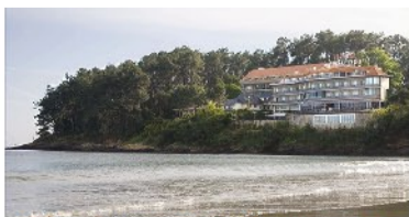
Gran Talaso Hotel Sanxenxo 4*