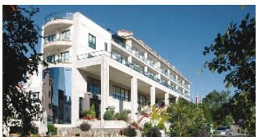
Hotel Carlos I Silgar 4*