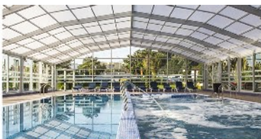
Hotel Nuevo Astur Spa 3*

Tres hoteles en el corazón de las Rías Bajas