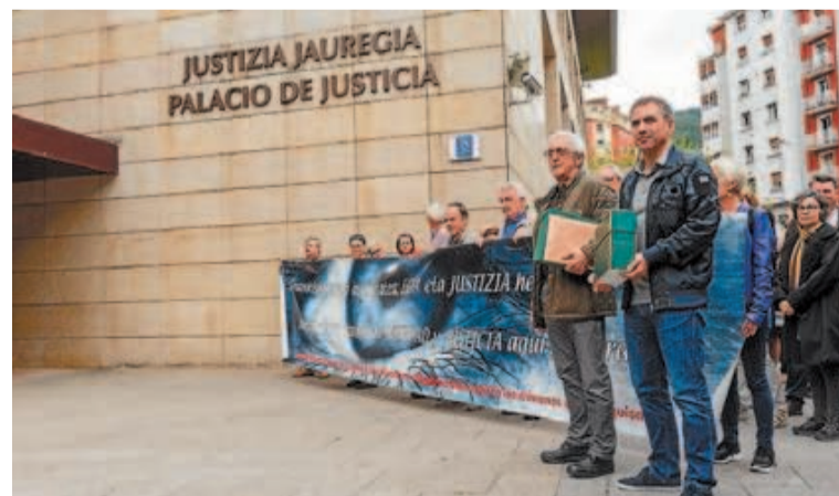
Ayuntamiento y Plataforma de Víctimas, en el juzgado.

La querrela recoge cincuenta testimonios orales. Entre 1960 y 1978 otros 700 eibarreses fueron represaliados. No en vano, en la querrela que se formaliza en Eibar se personarán una serie de denunciados, entre los cuales hay algunas víctimas de torturas por parte de la Guardia Civil y la Policía Nacional, también casos de asesinados