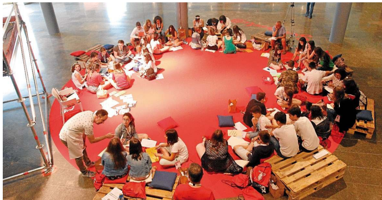
Un dos grupos de clubs de lectura escolar, onte no Pazo de Congressos de Compostela.