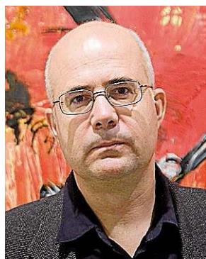
O artista Antón Patiño. VZ

Elaborou o guión do documental 'Maruja Mallo, metade anxo, metade marisco'