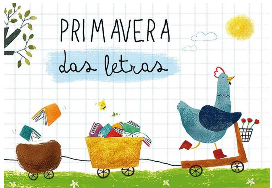
Primavera das Letras ofrece cinco fichas didácticas arredor da vida e obra de Casares

O proxecto web naceu en 2016 procurando un enfoque interdisciplinario