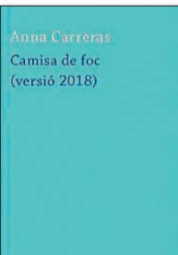
ANNA CARRERAS «Camisa de foc» NAVONA EDITORIAL 263 PÀGINES

Una història que atrapa des de la primera pàgina, bitàcola d'una obsessió per recuperar l'amor perdut, portarà la protagonista a la bogeria i l'assassinat. Primera novel·la d'Anna Carreras, que reescriu per a Navona Editorial, en la seva «versió 2018», la seva reinvençió i aconsegueix una novel·la sensacional, potent i única.