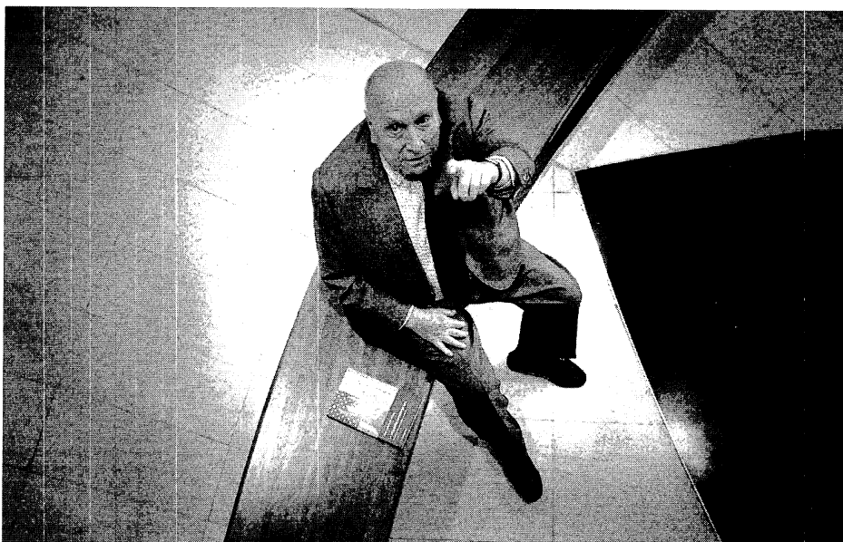
El pensador Jean-François Revel, fotografiado ayer en un restaurante del centro de Barcelona

LA RIVALIDAD CON FRANCIA. "Francia es líder del antiamericanismo europeo -explicaba ayer didácticamente, en la presentación de su libro-, porque desde la Revolución tenemos una vocación universal, de salvar a todo el mundo, muy presente también en la historia de EE.UU." Sin embargo, para Revel, el antiamericanismo europeo sufre una ausencia total de autocritica: "Europa es responsable de lo más negro del siglo XX: es Europa quien ha iniciado dos guerras mundiales, quien se ha quedado arruinada económicamente en 1945, quien ha inventado los dos mayores totalitarismos del siglo XX: el nazismo y el comunismo, por no hablar de otros menores, o quien mostró al mundo lo que es el colonialismo agresivo... Que EE.UU. sea