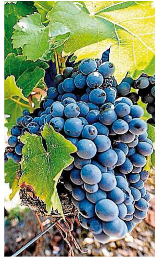
Racimo de uva de Valdeorras.

Al igual que años previos, Pando detalló que, con anterioridad a la feria, se celebrará una cata profesional y mañana se entregarán los premios a las bodegas ganadoras de este certamen oficial. “Son vinos y tintos de la añada de 2017 y, después, habrá menciones especiales”. REDACCIÓN