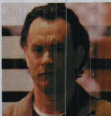
Arriba, el actor Tom Hanks. Abajo, el rodaje de «El Código Da Vinci».

El director de la película se las ha visto y deseado para poder rodar todas las secuencias en las verdaderas localizaciones que aparecen en el libro, pero, por el momento, el Museo del Louvre ya le ha facilitado sus salas para rodar de noche y todas las horas del día de cierre semanal. Así que el primer día de rodaje se pudo desarrollar entre las paredes que velan por la seguridad de la «Gioconda». ■