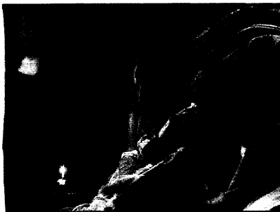
Imagen de la serie 'Los expedientes Da Vinci'. LOCALIA