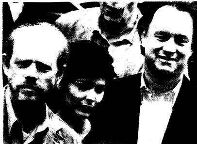
Código de cine: Ron Howard, Audrey Tatou y Tom Hanks.

A lo largo de seis episodios esta polémica serie de la productora Claxson realiza un exhaustivo recorrido por