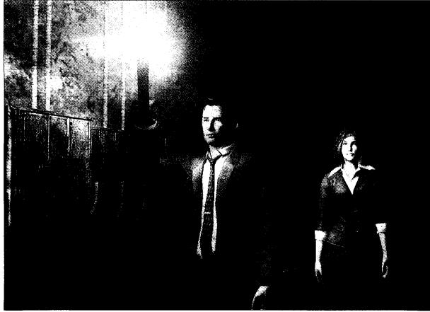
El suspense recorre también las escenas del videojuego.