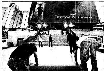
Operarios tienden la alfombra por la que desfilarán las estrellas.

Los filmes políticos también tendrán su lugar. Zidane un retrato del siglo XXI -presentada fuera de concurso- no podía tener mejor trampolín que la imagen de una fi-