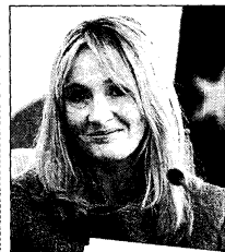
Joanne K. Rowling, madre literaria de Harry Potter.

En España el éxito de la colección ha sido gradual. En un principio el fichaje de Harry Potter hizo dudar a la joven editorial Salamandra, en cuya colección