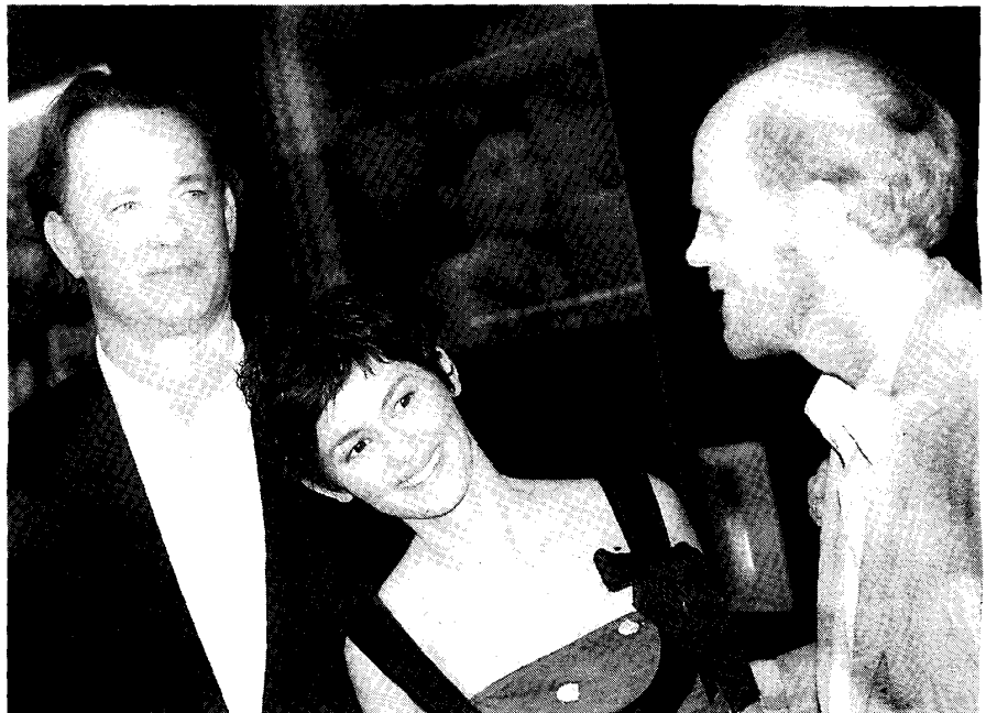
Los protagonistas de "El código Da Vinci", Tom Hanks, Audrey Tautou, y su director Ron Howard.

Entre las 20 películas aspirantes a la Palma de Oro este año es de notar la drástica reducción de presencia asiática, limitada al chino Lou Ye con "Sum-