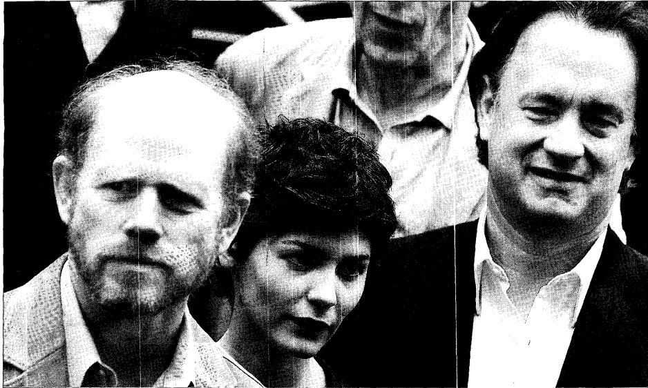
Ron Howard (l), director de 'El Código Da Vinci', posa con los dos protagonistas, Audrey Tautou y Tom Hanks en la que hoy es capital mundial del cine.