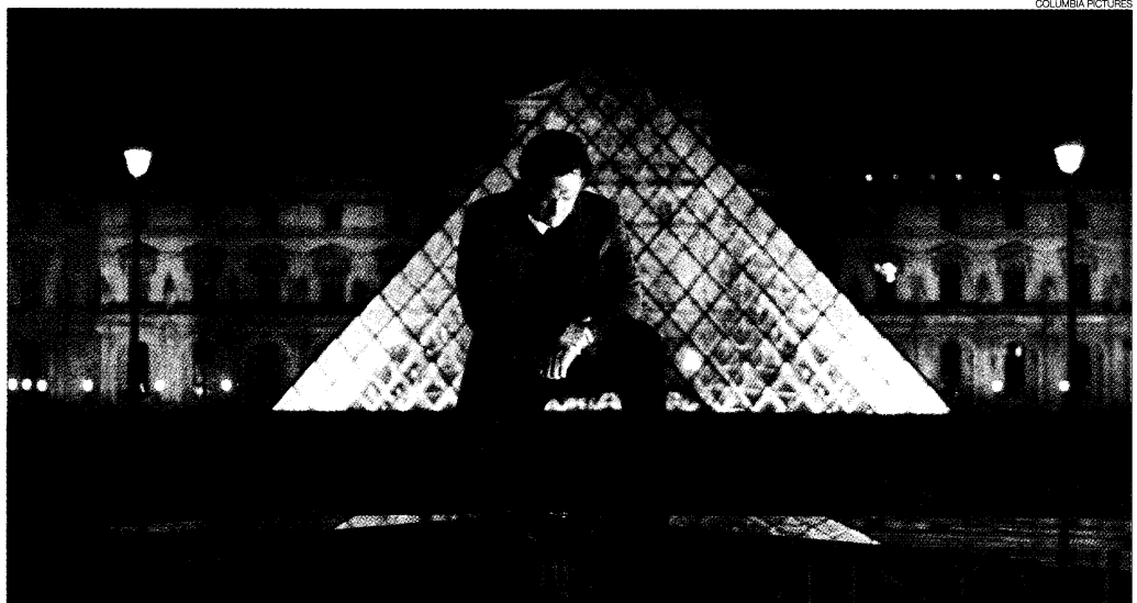
Tom Hanks, caracterizado de Robert Langdon, ante la pirámide del museo del Louvre de París en una imagen de El código Da Vinci .

Admirado en el seno de la industria tanto por su talento como su congenialidad, Tom Hanks mantiene el prestigio de ser un tipo decente y bastante real, a pesar de moverse en un mundo tan irreal como Hollywood. Por eso, no es de extrañar que aunque se meta en aguas turbulentas, como es el caso de la adaptación de El código Da Vinci , salga de ellas sin dificultad.