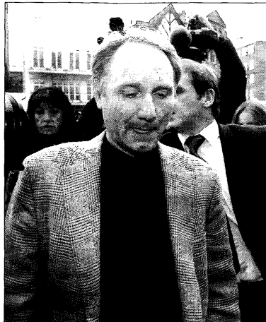
Dan Brown a su llegada, ayer, al Tribunal Supremo de Londres.

Sony ha emprendido una novedosa acción de relaciones públicas que pretende congraciarse con los críticos a la historia. Así, ha decidido poner en marcha una página web ( www.thedavincicodechallenge.com ) que sirva de plataforma a alguno de los críticos más combativos al libro y al largometraje. En el sitio de Internet se incluirán las colaboraciones de 45 escritores cristianos, de escolares, universitarios y líderes de organizaciones evangélicas, que expondrán sus argumentos en contra de la historia de Brown y aclararán sus puntos de vista.