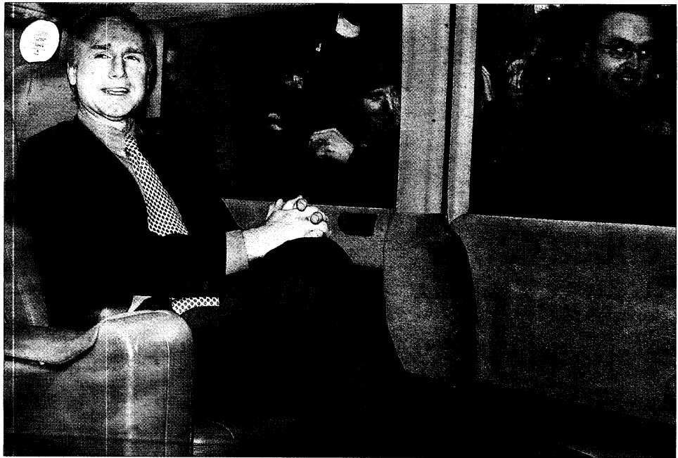
El escritor Dan Brown, en una limusina, a la salida del juicio por plagio que tuvo que afrontar en Londres.

Antes que Brown, Ken Follet ( Los pilares de la tierra ) y Umberto Eco ( El nombre de la rosa ) lograron captar con éxito el interés del público sin causar el rechazo de la crítica con una combinación de intriga e historia. Hasta la publicación de El código Da Vinci , Dan Brown era un escritor de segunda fila que había publicado tres novelas: La conspiración , Ángeles y demonios y La fortaleza digital . Ninguna de ellas había sido traducida al castellano. De hecho, cuando el Código comenzó a tener algún éxito en Estados Unidos, fue