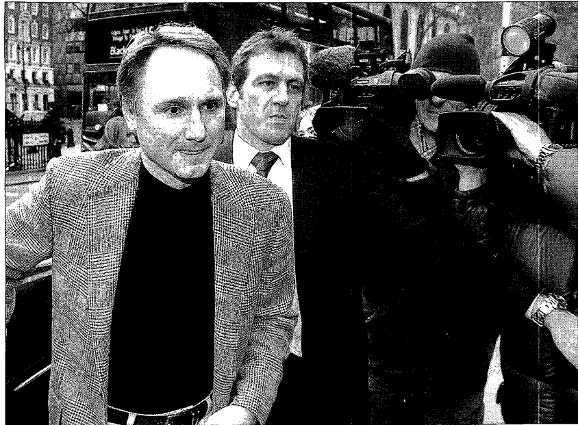
Dan Brown, en el momento de su entrada en el tribunal londinense