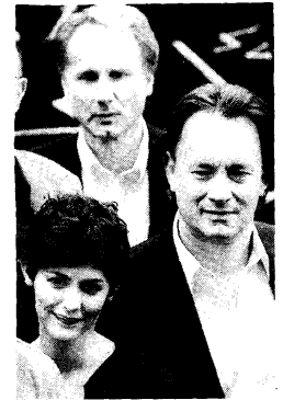
Tatou, Brown y Hanks

Sofía Coppola compete con María Antonieta con exteriores versallescos. Wong Kar Wai preside el jurado (entre cuyos distintos miembros figuran el director Patrice Leconte y las actrices Helena Bonham-Carter, Monica Bellucci y Zhang Ziyi) y tendrá, por tanto, la última palabra a la hora de elaborar el palmarés.