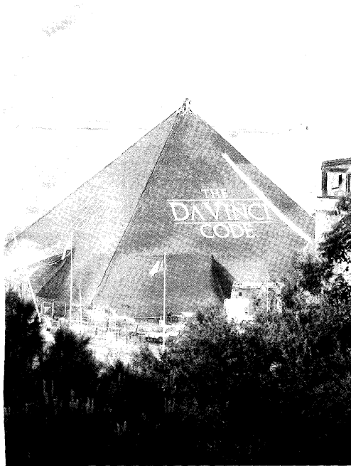
Una gran carpa publicitaria de El código Da Vinci , en Cannes

Además, no olvidemos, que el Museo del Louvre tiene un papel importante en la trama. Esta promoción no se paga con dinero, como tampoco la proporcionada inicialmente por el Opus Dei, con sus atropos a la película. Además, el propio presidente Jacques Chirac, en un momento político menos revuelto que el actual, recibió en su despacho al director Ron Howard, dándole incluso consejos para el casting. En su opinión, el papel de Sophie Neveu debía interpretarlo Sophie Marceau. Howard prefirió escoger a la políglota Audrey Tatou, deliciosa antiheroína de Amélie . Por parte francesa también figura en el repar-