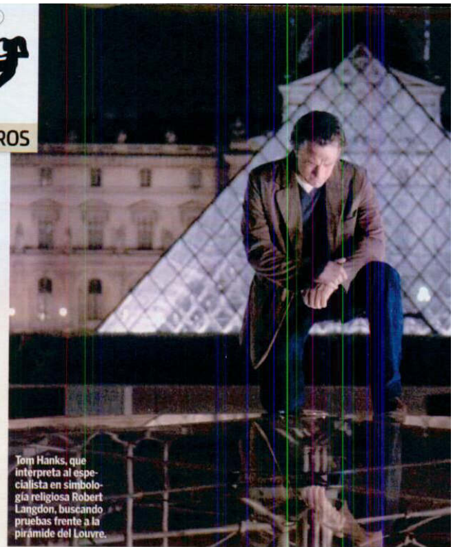
Tom Hanks, que interpreta al especialista en simbología religiosa Robert Langdon, buscando pruebas frente a la pirámide del Louvre.