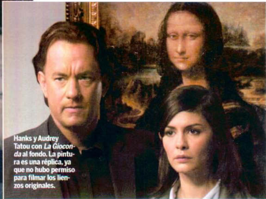
Hanks y Audrey Tatou con La Gioconda al fondo. La pintura es una réplica, ya que no hubo permiso para filmar los lienzos originales.