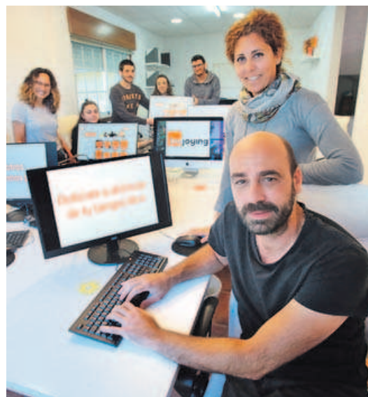
En su base de datos tienen cerca de 65.000 fiestas.

Instalados en Mos, los chicos de Imjoying se han pasado los últimos años rastreando y recopilando fiestas y eventos de todo el territorio español, llamando uno por uno a cada ayuntamiento. El resultado es un mapa alimentadísimo, unas 65.000 chinchetas que mar-