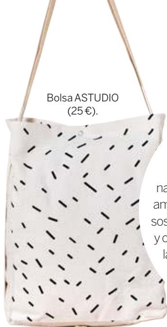
Bolsa ASTUDIO (25€).