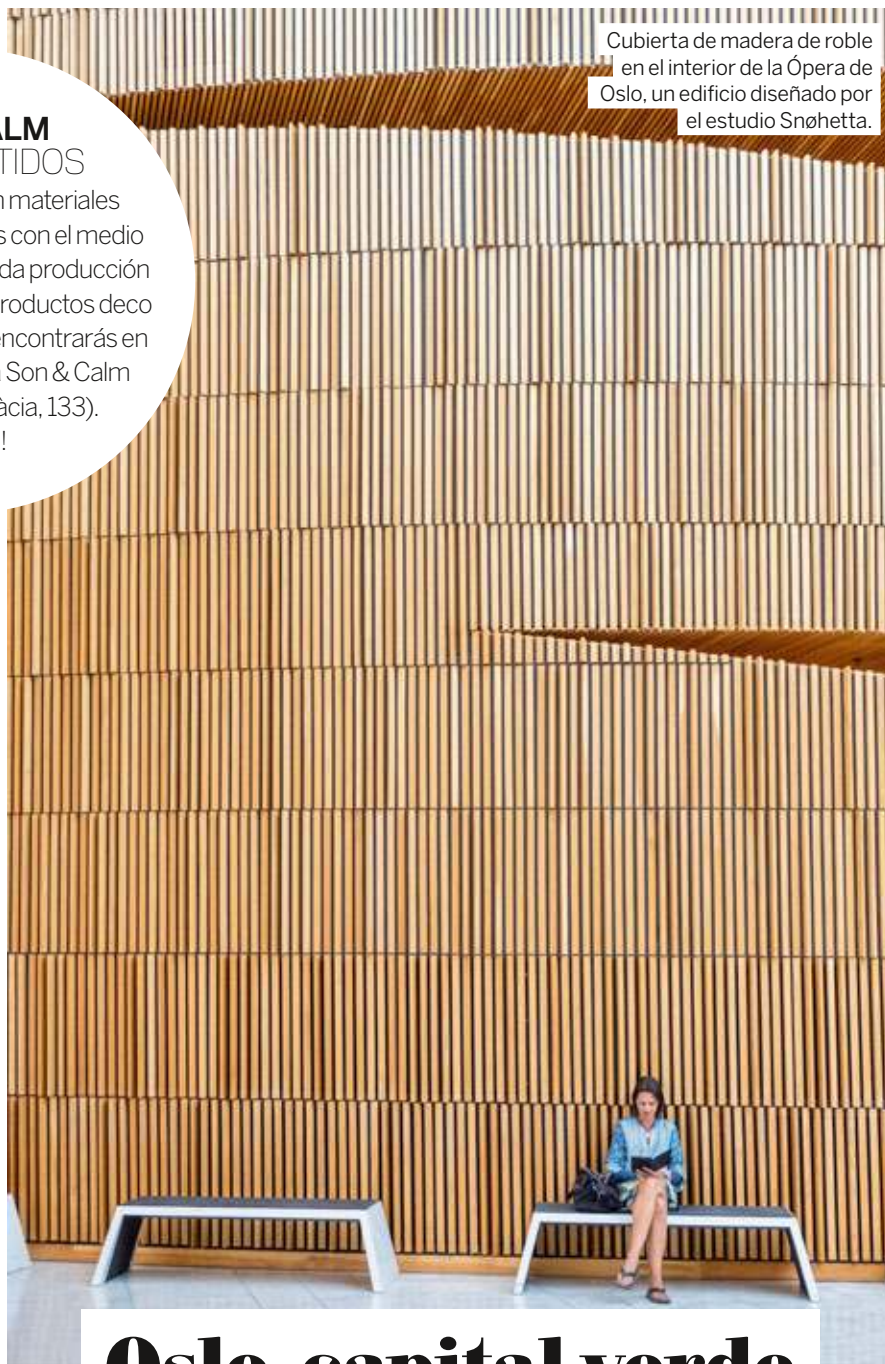
Cubierta de madera de roble en el interior de la Ópera de Oslo, un edificio diseñado por el estudio Snøhetta.

Hechos a mano, con materiales naturales, respetuosos con el medio ambiente y de acreditada producción sostenible. Así son los productos deco y complementos que encontrarás en la tienda barcelonesa Son & Calm (Travessera de Gràcia, 133). ¡Preciosa!