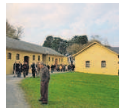
Instalaciones de la granja Pedro Murias, en Vilaframil.