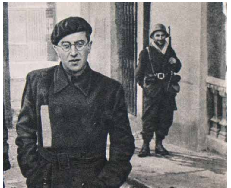
Kim Philby, en España, durante la Guerra Civil.