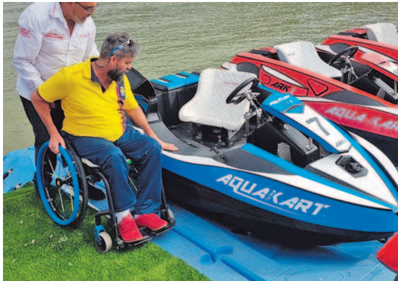
El aquakart adaptado es una de las grandes novedades de este verano en el circuito Racing Dakart, en Major.

La polución por plástico es sin duda el azote medioambiental de nuestra era, la batalla más urgente a la que debemos enfrentarnos en materia de sostenibilidad del planeta. Este libro nos ayudará a ser conscientes de que hay pequeños cambios que pueden marcar la diferencia, como comprar una taza de café reutilizable, usar champú en pastilla y poner la ropa en la lavadora dentro de una bolsa de rejilla que impida que se liberen microfibras, la causa del 30 % de la polución por plástico en los océanos. No va a ser fácil hacer desaparecer el plástico de nuestras vidas. Esta es una llamada a filas, a aunar fuerzas a lo largo de todo el mundo para plantar cara a uno de los mayores retos medioambientales de nuestro tiempo.