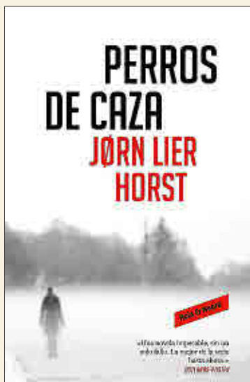
Perros de caza Jørn Lier Horst Penguin Random House, 2020