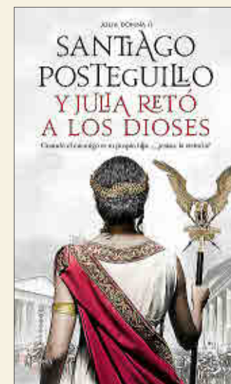
Y Julia retó a los dioses Santiago Posteguillo Planeta, 2019

❖ Anne Jacobs, creadora de la saga La villa de las telas , es una de las autoras alemanas con más éxito de los últimos años. A principios de marzo se publicó su nueva novela, La mansión . Tiempos gloriosos, primera entrega de una saga familiar ambientada en la Alemania de la Segunda Guerra Mundial que combina los ingredientes que mejor domina la autora: romance, drama, personajes fuertes y una recreación histórica apasionante que han convertido sus novelas en un fenómeno editorial.