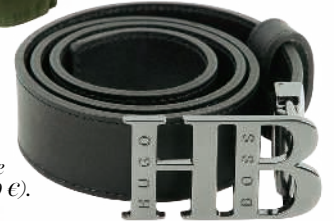
Cinturón de Hugo Boss.