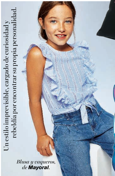
Blusa y vaqueros, de Mayoral.

Un estilo imprevisible, cargado de curiosidad y rebeldía por encontrar su propia personalidad.