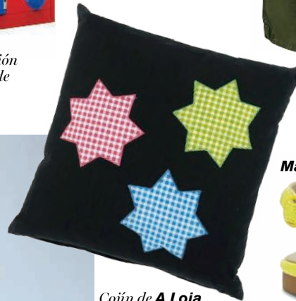
Cojín de A Loja do Gato Preto (6,50 €).