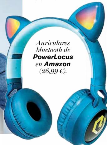
Auriculares bluetooth de PowerLocus en Amazon (26,99 €).

Un estilo imprevisible, cargado de curiosidad y rebeldía por encontrar su propia personalidad.