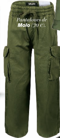
Pantalones de Molo (70 €).