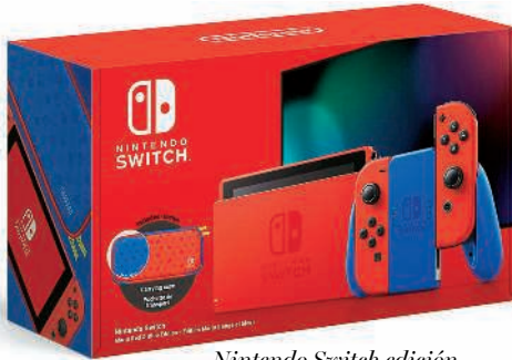
Nintendo Switch edición Mario (rojo y azul) de Nintendo (355 €).