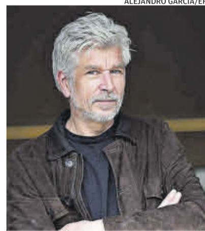
Karl Ove Knausgård.

A més, no va amagar que, encara que havia començat abans de la pandèmia, l'escriptura d'aquest llibre el va agafar també durant els mesos de