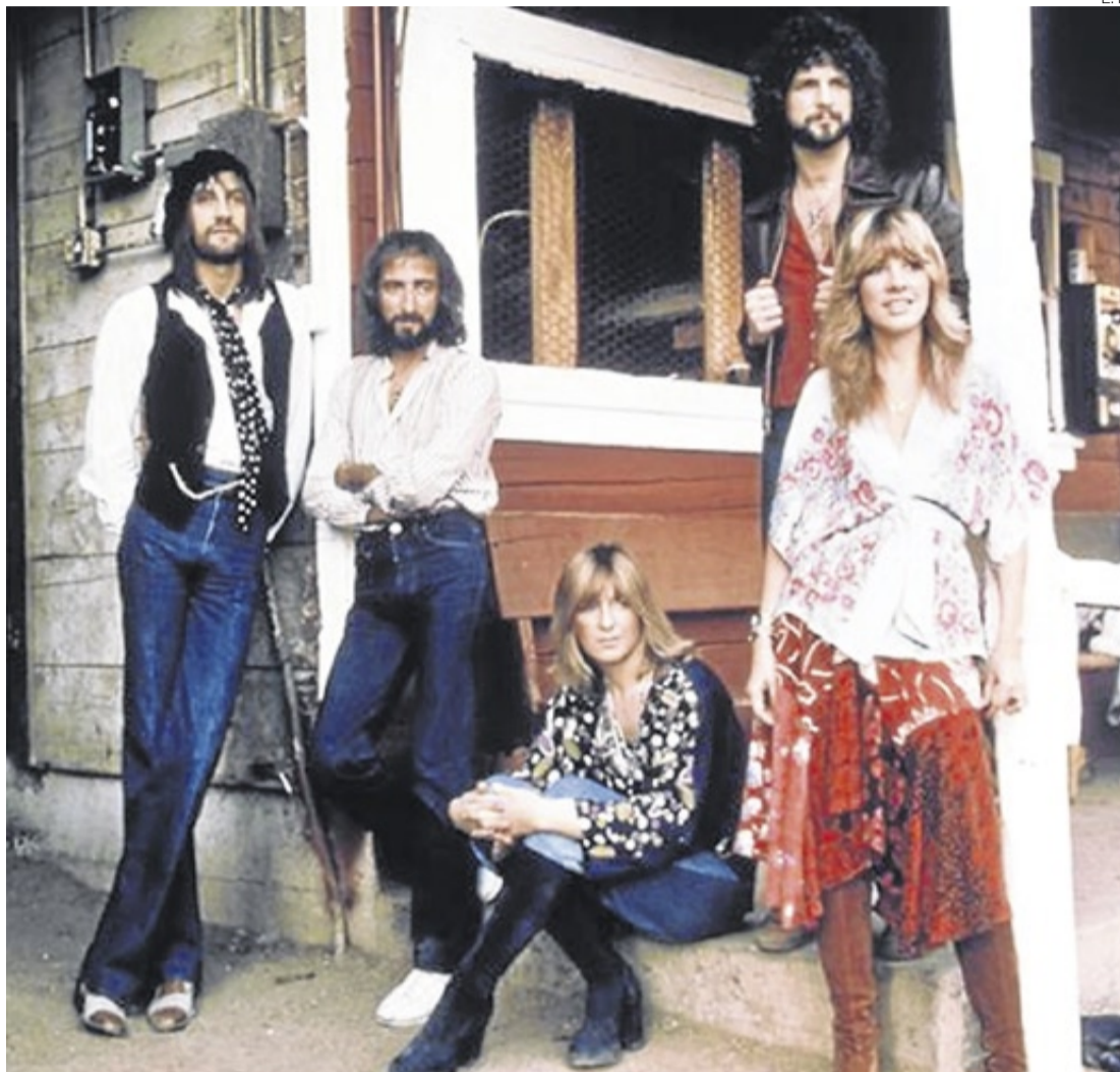
►► Legendarios ► El grupo anglo-norteamericano Fleetwood Mac, en una imagen de los 70.

Curiosamente, con solo días de diferencia ha llegado a España Los siete maridos de Evelyn Hugo (Umbriel), novela anterior de Reid sobre las peripecias de otro icono pop imaginario, una actriz de la era dorada de Hollywood. ¿Con siete maridos? Sosias de Liz Taylor, claro. «Evelyn Hugo y Daisy Jones existen en el mismo mundo —explica Reid sobre sus creíbles creaciones—, y estoy segura de que en algún universo, en algún lugar, podrían tropezarse en la misma fiesta de Hollywood».