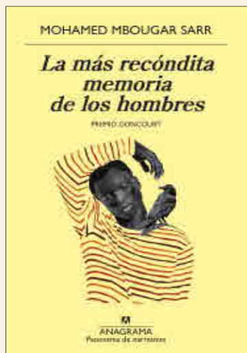
Mohamed Mbougar Sarr La más recóndita memoria... ANAGRAMA

❖ El reino de Azenor está invadido por una maldición. Cada luna nueva, la magia fluye desde la montaña cercana y hace que las pesadillas de los ciudadanos cobren vida. Solo los magos, que ejercen de guardianes del territorio, pueden interponerse entre las personas y sus peores sueños. Clementine Madigan está lista para asumir el cargo de guardiana de su pequeño pueblo, pero cuando dos magos llegan para desafiarla, se ve envuelta en un conflicto centenario sin siquiera saberlo.