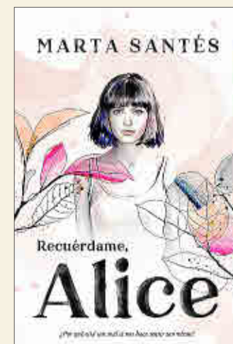
Marta Santés Recuérdame, Alice TITANIA

❖ Un nuevo dios viviente es coronado al morir el gran Amenhotep III. Su hijo Amenofis es ahora faraón de Egipto. Pero los tiempos de bonanza y paz están por acabar: renacen las hostilidades con los pueblos vecinos, hasta ahora aliados, pero también entre las dos mujeres que buscan comprar el trono, la cortesana Nefertiti y la princesa de Mitanni Teryshepa; y el mismo faraón provoca un cisma interno al derogar el culto a los dioses tradicionales e imponer la veneración a Atón, único dios verdadero.