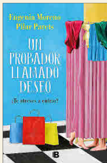
Eugenia Moreno y Pilar Parets Un probador llamado deseo EDICIONES B

❖ El joven escritor africano residente en París Diégane Latyr Faye descubre una misteriosa novela perdida, escrita en los años treinta, y decide indagar sobre el autor desaparecido. Tirando de diversos hilos, con la ayuda de una enigmática mujer que guarda muchos secretos y de un grupo de jóvenes escritores africanos que beben, aman y escriben con desafuero, el protagonista se embarca en un viaje en busca de un mito y acaso también de sí mismo. Galardonada con el Premio Goncourt, nos descubre a un escritor de inventiva arrolladora.