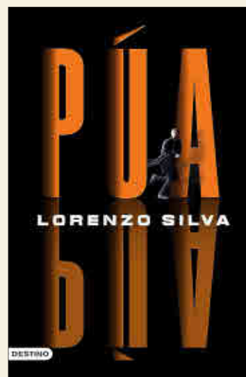
Lorenzo Silva Púa DESTINO

❖ Durante el crudo invierno de 1620 un espantoso crimen ha sembrado el pánico en cada rincón de Madrid: una joven ha sido violada y enterrada junto a un niño al que le han extirpado el corazón. Nadie en la Villa duda de que se trata de un asesinato ritual y pronto surge en los mentideros un «libelo de sangre» contra el escribano Sebastián Castro y su esposa Margarita, una acusación falsa que culpa a los judíos de sacrificar a menores cristianos. Alonso, el hijo mayor del matrimonio, tratará de averiguar la verdad tras el crimen.