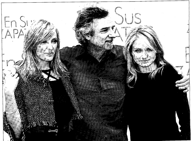
Las actrices Toni Collette y Cameron Díaz (derecha), junto al director Curtis Hanson.

La película, basada en la novela de Jennifer Weiner, editada en España por Umbriel, cuenta la relación entre dos hermanas opuestas que tan sólo tienen en común su número de zapato y la sensación de que no consiguen ser felices a pesar de sus intentos por lograrlo. Rose (Toni Collette) es una mujer seria que tiene una nefasta suerte con los hombres. Sin embargo, su hermana Maggie (Cameron Díaz) respira sensualidad por todo su cuerpo y su éxito con los hombres es tal que llega incluso a robar a su hermana el único ligue que ha logrado. "La sociedad exige demasiado a las mujeres y no es nada realista. No sólo tienen que ser estupendas, sino que tampoco tienen que envejecer. Las mujeres de esta pe-