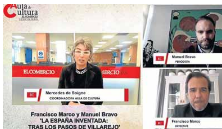
Uno de los instantes de la intervención telemática de los autores.

AVILÉS. En las más de cuatro décadas de historia que ya suma la democracia española, pocos personajes han resultado tan esquivos y, a la par, determinantes como el excomisario de la Policía Nacional José Manuel Villarejo, líder de una tupida red de tráfico de información que, desde finales del franquismo, condicionó la evolución de la realidad política del país. Y a ese papel está dedicado el libro 'La España inventada. Tras los pasos de Villarejo', cuyos autores, el detective Francisco Marco Fernán-