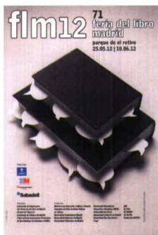
El artista Chema Madoz es el autor del cartel de la Feria del Libro 2012.

Hasta el 10 de junio el sector tratará de poner buena cara en las 356 casetas instaladas en el Paseo de Coches del Retiro, y demostrar al público que tie-