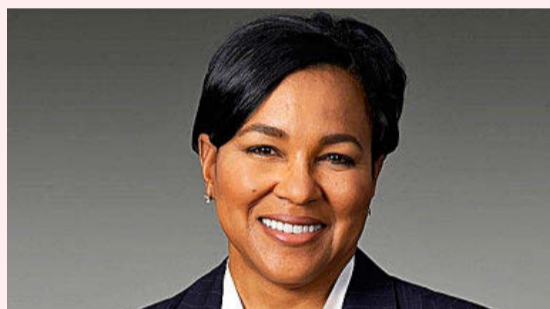
Rosalind Brewer, consejera delegada de Walgreens.