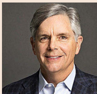
H. Lawrence Culp Jr.