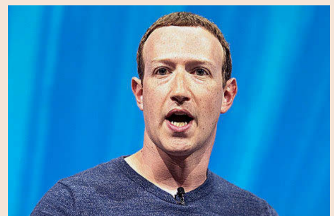
Mark Zuckerberg, fundador de Meta Platforms (Facebook).