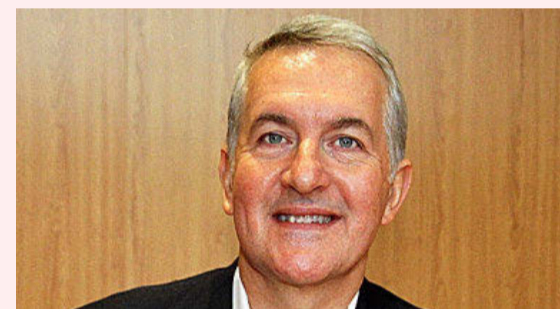
Ramón Laguarta, presidente de Pepsico.

de las directivas que más cursos de posgrado ha realizado en distintas universidades de élite a lo largo de su carrera profesional: Chicago Booth, Stanford y Wharton. De joven, estudió químicas en Spelman, institución universitaria para mujeres en Atlanta.