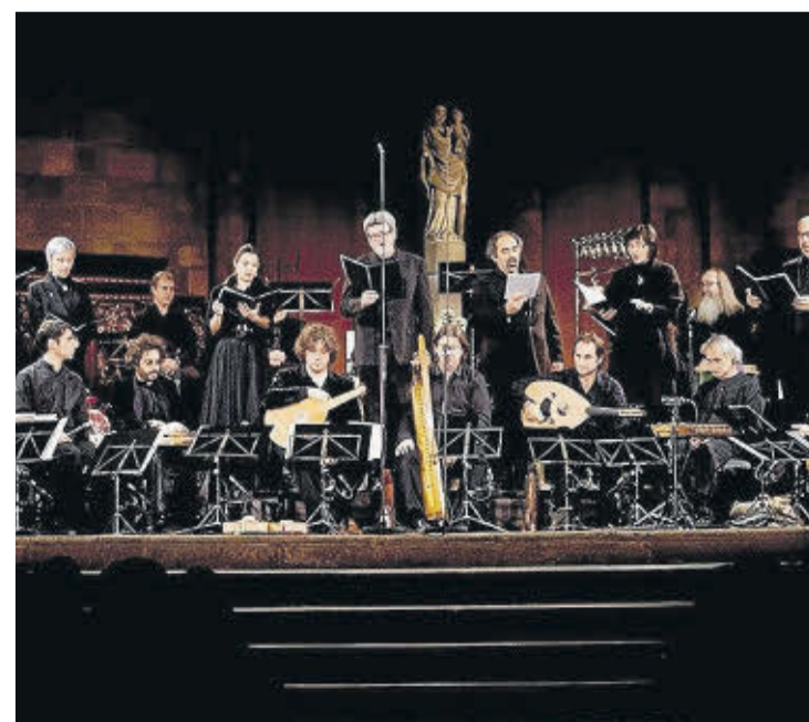
Una de las actuaciones celebradas durante el Festival Jordi Savall. Poblet y Santes Creus acogerán doce conciertos.

Los conciertos de noche, a las 22 horas, protagonizados por Jordi Savall proponen un viaje a través de la historia con un programa dedicado a Alfonso X El Sabio, hasta músicas del Renacimiento. También se podrá escuchar música del Barroco francés, así como un concierto de homenaje a San Ignacio de Loyola.