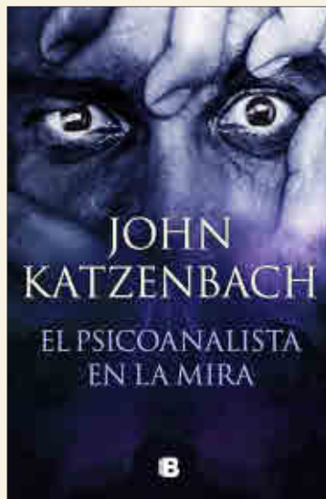
John Katzenbach El psicoanalista en la mira EDICIONES B

❖ En el reino de Valerya, donde la sangre de los Dioses corre por las venas de los nobles, Anna no es más que una criada que tiene prohibido acercarse al fuego. La culpa la tiene Bastien Doyle, el hijo de sus señores, que estuvo a punto de morir quemado vivo en un accidente. Aunque se salvó, la quemadura que le recorre media cara es la máscara perfecta para esconder lo que lleva en su interior. Lya Viride, que es una decepción para sí misma y para los demás, intenta hacerse un hueco en su corazón.