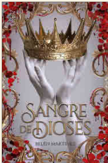
Belén Martínez Sangre de dioses PUCK

❖ La tragedia ha golpeado al Cuerpo Aéreo de Su Majestad, cuya magnífica flota de dragones luchadores y sus capitanes humanos defienden con valentía las costas de Inglaterra de los ejércitos de Napoleón. Una epidemia de origen desconocido está diezmando los rangos de los nobles dragones, forzando a los afectados a entrar en cuarentena. Tan solo Temerario y un grupo de dragones recién reclutados permanecen libres de la infección, y se mantienen como la única defensa aérea contra las osadas incursiones francesas.