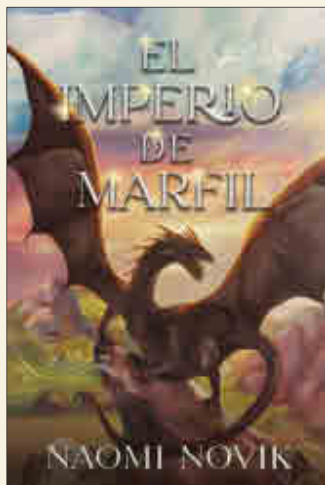
Naomi Novik El imperio de marfil UMBRIEL

❖ La tragedia ha golpeado al Cuerpo Aéreo de Su Majestad, cuya magnífica flota de dragones luchadores y sus capitanes humanos defienden con valentía las costas de Inglaterra de los ejércitos de Napoleón. Una epidemia de origen desconocido está diezmando los rangos de los nobles dragones, forzando a los afectados a entrar en cuarentena. Tan solo Temerario y un grupo de dragones recién reclutados permanecen libres de la infección, y se mantienen como la única defensa aérea contra las osadas incursiones francesas.