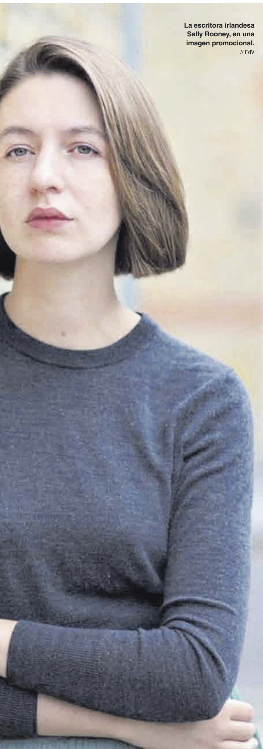
La escritora irlandesa Sally Rooney, en una imagen promocional.